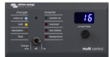
Tableau de commande numérique Multi Control Une solution pratique et bon marché pour une surveillance à distance, avec un bouton rotatif pour configurer les niveaux de PowerControl et PowerAssist.

Sonde de courant 100 A:50 mA Afin d'implémenter les fonctions PowerControl et PowerAssist et pour optimiser l'autoconsommation grâce à une sonde de courant externe. Courant maximal : 50 A, 100 A respectivement. Longueur du câble de connexion : 1 m.