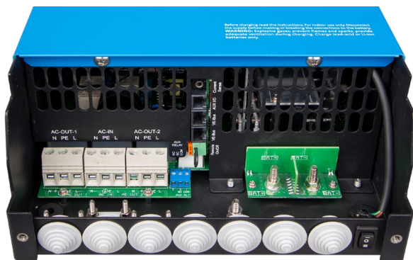
Zone de connexion

Permet de mesurer la tension de batterie et la température et de superviser et contrôler le système avec un Smartphone ou tout autre dispositif équipé de Bluetooth.