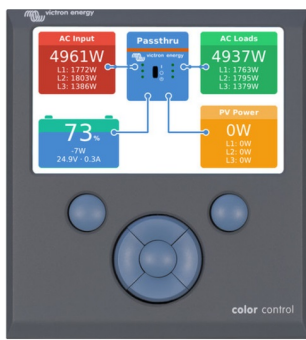
Tableau de commande Color Control (CCGX)

Permet un contrôle et une supervision intuitifs du système En plus du contrôle et de la supervision du système, le CCGX permet d'accéder à notre site Web gratuit de supervision à distance : le portail en ligne VRM.